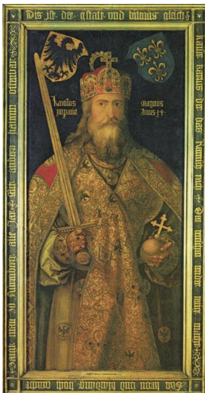
Idealisierte Darstellung Karls des Großen von Albrecht Dürer aus dem Jahr 1513.