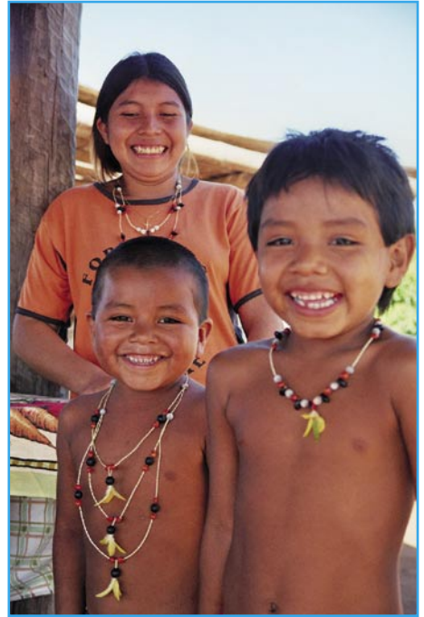
Fröhliche Guarani-Indianer aus Brasilien.

Der Arbeitskreis „Partner der Weltkirche“ veranstaltete am Sonntag, 28. Februar, einen Solidaritätstag