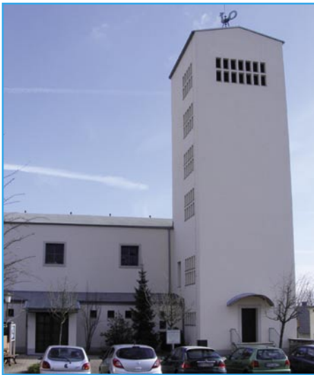
St. Nikolaus in Niederhöhnstadt

„Schwalbach hat eine alte Geschichte und ist heute mit der später dazu