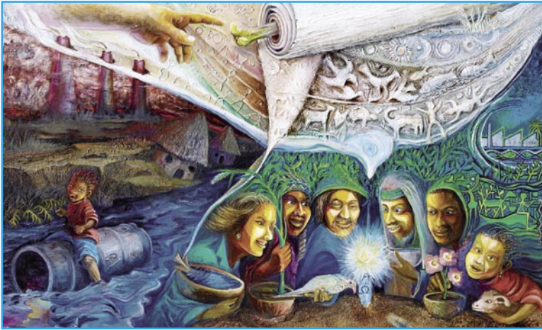
So sieht das diesjährige MISEREOR-Hungertuch aus.

Unter dem Leitwort „Gottes Schöpfung bewahren, damit alle leben können“ informiert das bischöfliche Hilfswerk MISEREOR in seiner diesjährigen Fastenaktion über die bereits spürbaren Folgen des Klimawandels und ruft dazu auf, dessen Opfern in den Südkontinenten solidarisch beizustehen.