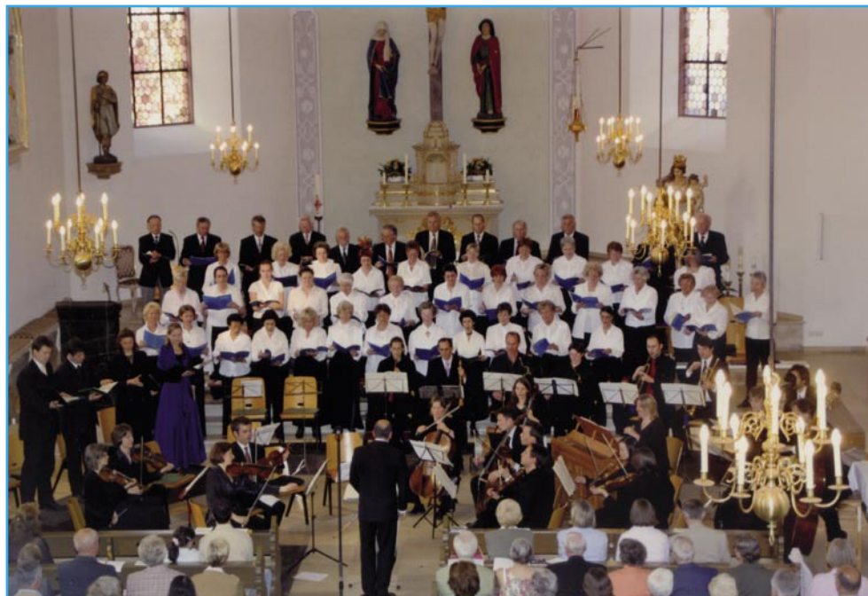
Der Kirchenchor bei seinem großen Konzert in der Pfarrkirche im Jahr 2006.