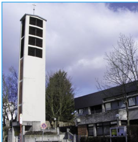
Christkönig in Eschborn