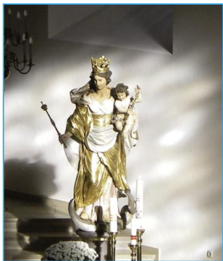
Die Marienstatue in der Pfarrkirche.

Die ersten Wochen habe ich mich gefühlt wie in einem Urlaub, der nicht enden wollte. Es war immer noch einiges aufzuarbeiten, was liegen geblieben war. Da musste ich Ordnung