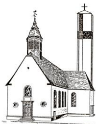
Pfarrkirche St. Pankratius