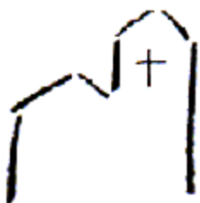
St. Nikolaus Niederhöchstadt