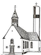
St. Pankratius Schwalbach