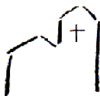
St. Nikolaus Niederhöhnstadt