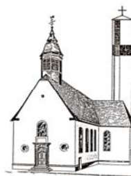
Pfarrkirche St. Pankratius