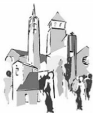
St. Marien und St. Katharina Bad Soden

Pfarreien im Pastoralen Raum Main-Taunus-Ost