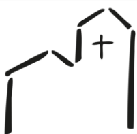
St. Nikolaus Niederhöchstadt