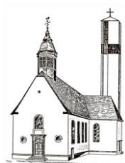
St. Pankratius Schwalbach

Einen schönen Sommer wünschen Ihnen die Redaktion und die Herausgeber des „Pfarrbrief für 4“, die Pfarrsekretärinnen und die Seelsorgerinnen und Seelsorger