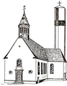
St. Pankratius Pfarrkirche